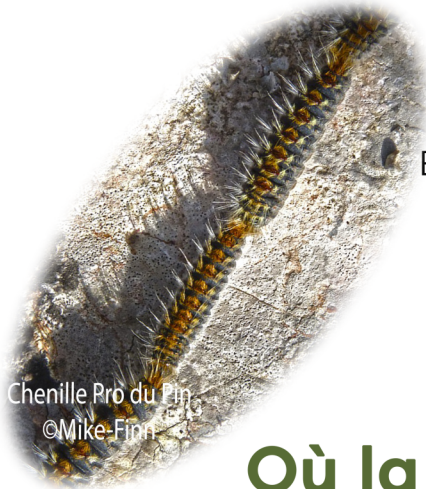
Chenille Pro du Pin